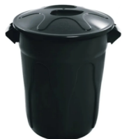
JSN LIXEIRA PLÁSTICA 12,5L 29CM REDONDA PRETA / TAMPA - EB1P 10287