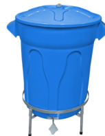
JSN LIXEIRA PLÁSTICA 60L AZUL C/ TAMPA CR60A 26228